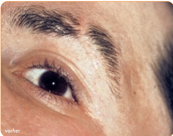
Pigmentierung einer Narbe im Augenbrauen-Bereich

Narben können schmerzen, jucken und sogar die Beweglichkeit einschränken. Doch auch im kosmetischen Bereich wirken Narben oft störend und stellen nicht selten eine seelische Belastung für den Betroffenen dar. Hier können Sie mit Permanent Make-up Hilfestellung bieten.