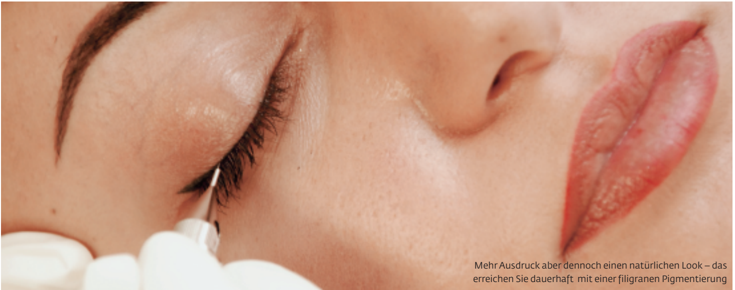
Mehr Ausdruck aber dennoch einen natürlichen Look – das erreichen Sie dauerhaft mit einer filigranen Pigmentierung

Eine Pigmentierung am oberen und/oder unteren Lidrand lässt die Wimpern dichter wirken, perfektioniert die Augenform und sorgt für mehr Ausdruck. Was es bei der Wimpernkranzverdichtung zu beachten gilt und welche Techniken beim Pigmentieren zum Einsatz kommen, lesen Sie hier